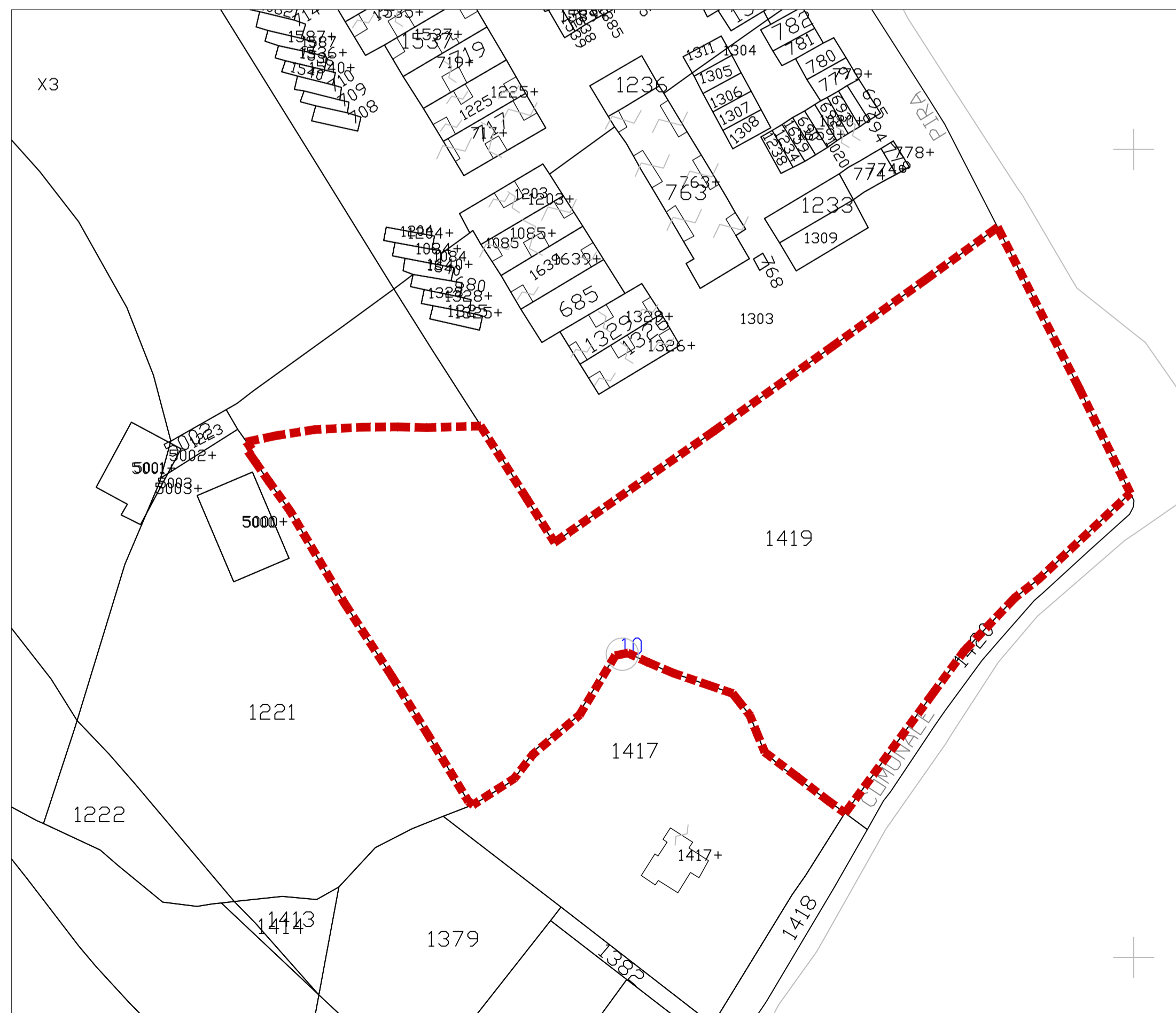
3. STRALCIO CATASTALE - FOGLIO 36 MAPPAL 1419 - SCALA 1:1000