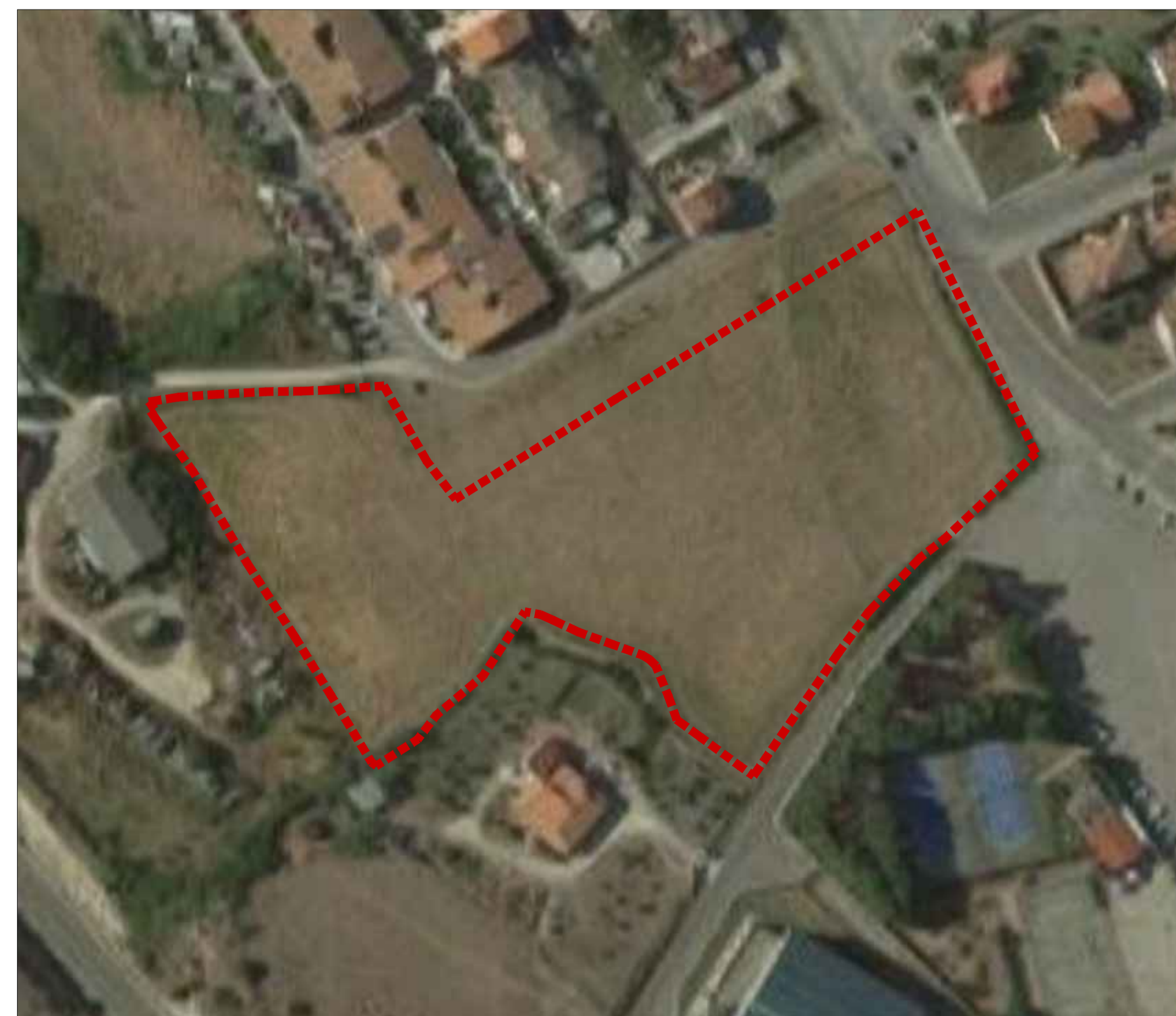
4. FOTO AEREA - SCALA 1:1000